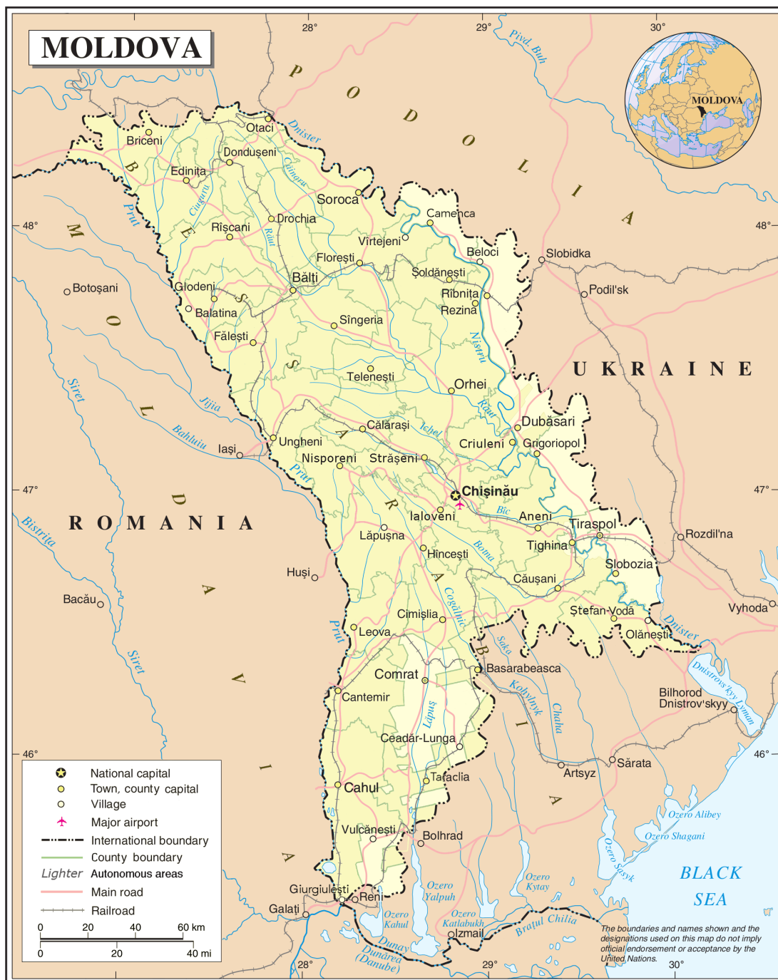
Carte de la Moldavie

et secs dans le sud, La latitude est comprise entre le 45° et le 48° parallèle. Le pays contient un très grand nombre de cours d'eau. Il y a 57 lacs naturels et plus de 3000 étangs, lacs d'accumulation et réservoirs artificiels afin de retenir l'eau pour la période estivale sèche. Les crues sont fréquentes au printemps et les débits des cours d'eau sont très faibles en été. L'ensoleillement est de 200 jours par an en moyenne, ce qui est satisfaisant pour la viticulture. 10% du pays est couvert par de la forêt à majorité des feuillus.