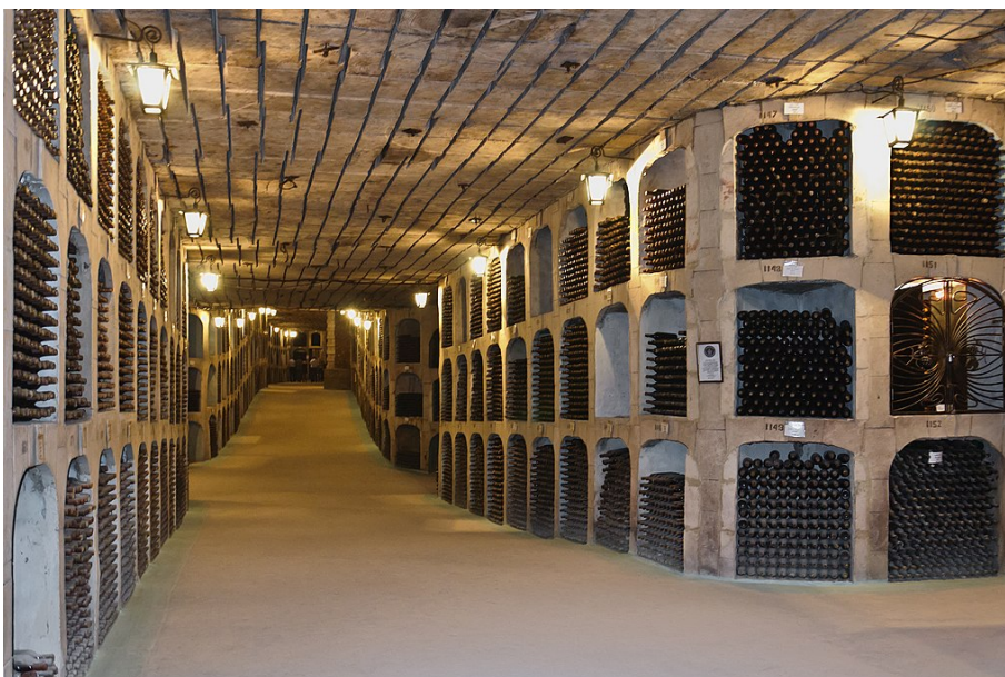
Les caves de Milestii Mici

Milestii Mici wine : Cette cave est située aux alentours du village de Mileștii Mici, non loin de la capitale moldave, Chișinău. C'est une entreprise publique spécialisée dans la production, la conservation et la commercialisation des boissons alcoolisées. La cave Mileștii Mici détient le