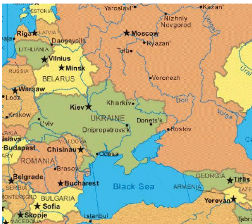
Localisation de la Moldavie

La République de Moldavie est située à 48°30 de latitude nord et 30°10 de longitude entre la Roumanie et l'Ukraine. Séparée de la mer Noire par la région ukrainienne d'Odessa, ses frontières longent le Danube sur quelques centaines de mètres à l'extrême sud du pays. La superficie de la Moldavie est de 33.700 km 2 . La capitale est Chisinau dans le centre du pays. Le vignoble en Moldavie, occupait 117 000 hectares en 2023, ce qui représente 1,9% du vignoble mondial (sources OIV, 2024).