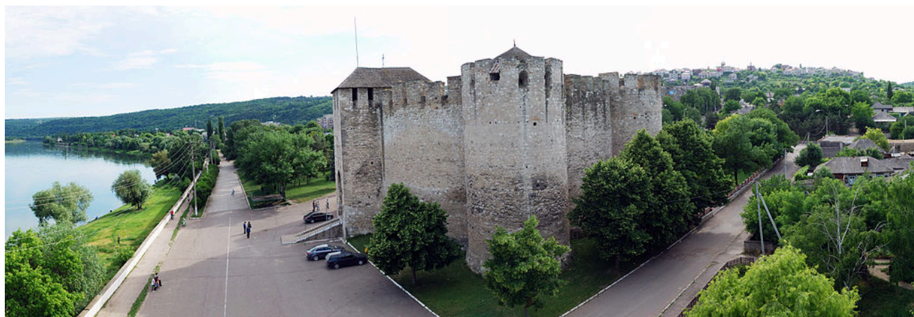
Paysage moldave à Soroca avec le fleuve Nistre et la forteresse.